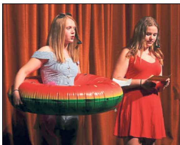
Die Schüler des Faches Darstellen und Gestalten führen durchs Programm.