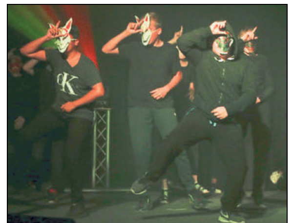
Die 6 Phönix kann mit ihrem Tanz zum Videospiel »Fortnite« begeistern.