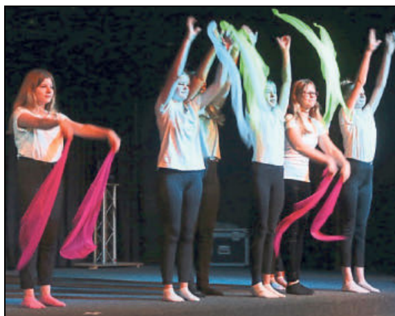
Mit den bunten Tüchern ist der Auftritt des DG-Kurses aus Jahrgang 7 ein Hingucker.

Für das Finale des Abends waren die Lehrer selbst zuständig: In Kostümen sangen sie »Country Roads« und die Schüler stiegen schnell mit ein.