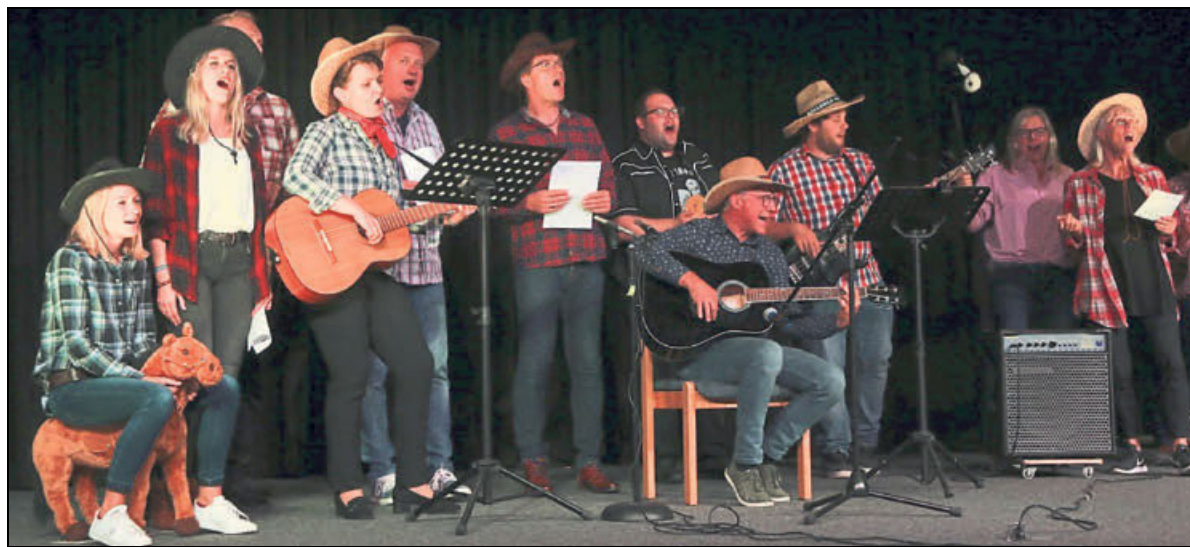
Das Programm des Palmeabends war nicht nur den Schülern überlassen. Auch der Lehrerchor wirkt lautstark mit. Er tritt mit »Country Roads« von John Denver auf.